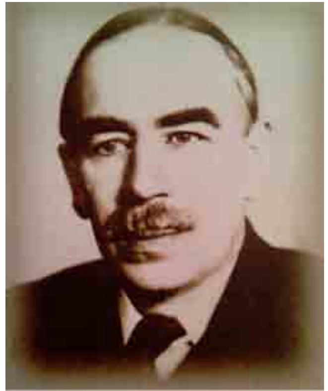
John Maynard Keynes

Meine These lautet: Das Scheitern des Systems war bereits 1944 in den Ergebnissen der Konferenz von Bretton-Woods angelegt als man sich für den US-Dollar als internationales Ausgleichsmittel entschied, welcher zugleich als US-Währung fungierte. Es ist zu zeigen, dass ein internationales Zahlungsmittel neutral Gläubiger und Schuldner belasten sollte, wie dies im Bancor-Plan von Keynes vorgesehen war. Ein Ausgleichsmittel, das gleichzeitig Tauschmittel eines Landes ist, kann für beide Zwecke kontraproduktiv sein. Diese Doppelrolle der US-Währung für zwei Herren, nämlich als nationales Zahlungsmittel und zugleich als internationales Medium hat dazu geführt, dass die nationale Währung inflationierte und auf längere Sicht ihre Qualität als Ausgleichsmedium für Zahlungsbilanzdefizite verlor. Es ist auch zu zeigen, dass und wie ein internationa-